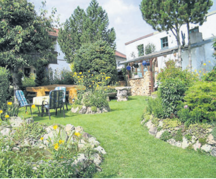
Vom Garten aus gelangt man in kleine Nebengebäude, in denen man „Waschen anno dazumal“ und landwirtschaftliche Arbeiten von früher findet.