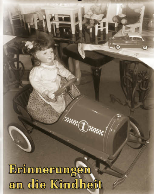
Erinnerungen an die Kindheit