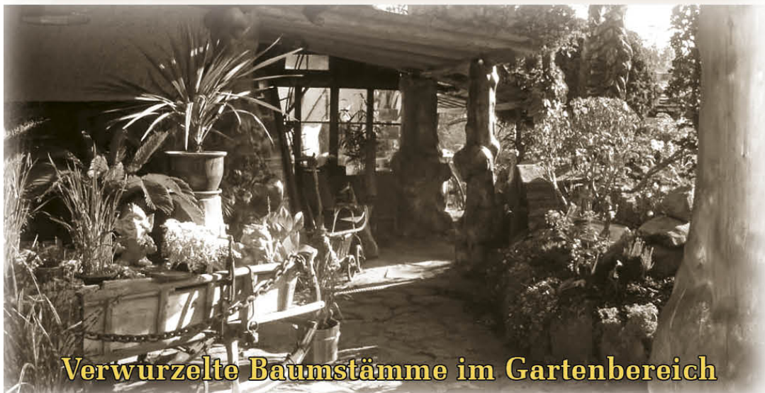
Verwurzelte Baumstämme im Gartenbereich